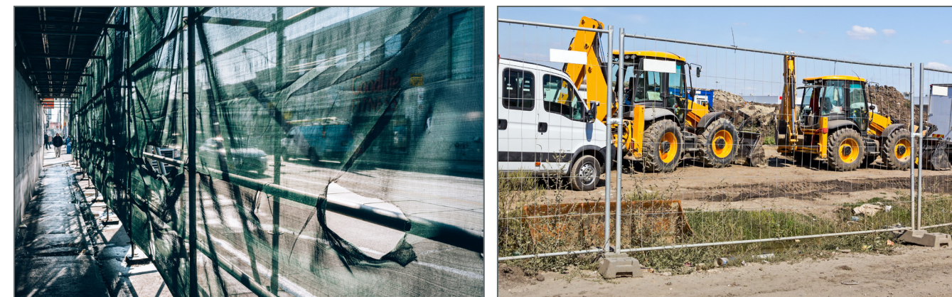
Exemples de clôture et accès